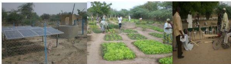
Panneaux solaires installés dans les jardins maraîchers et fruitiers matériels de jardinage