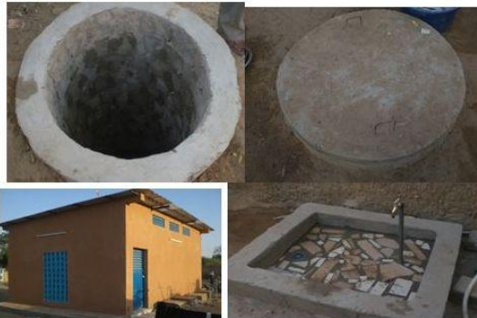
Une latrine, un puisard, un édicule et un évier construits