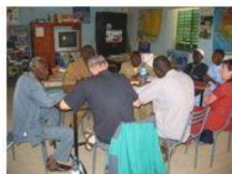
Mission annuelle d'évaluation

Commune de Conflans Association AJTC à Conflans Syndicat des Eaux d'Ile de France MAE, SIAAP, AESN, FALP... Commune de Tessaoua Populations bénéficiaires