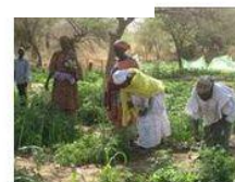
Appui au jardin fruitier et maraîcher