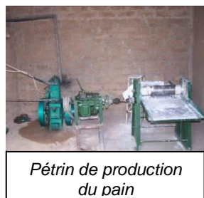
Pétrin de production du pain