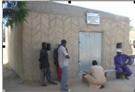
UNE BC CONSTRUITE PAR LES VILLAGEOIS