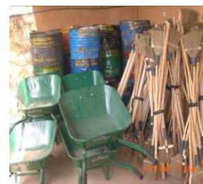
Matériels de salubrité