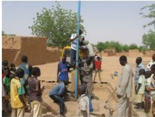
changement des tuyaux