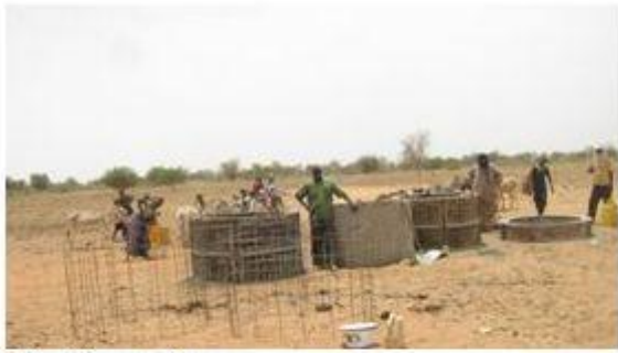
Férrillage et buses