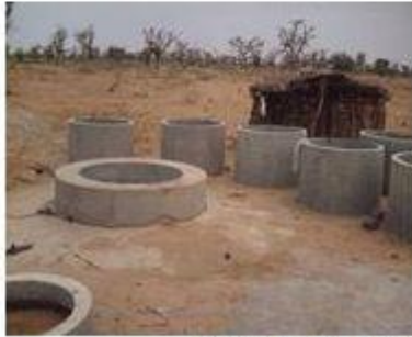
Introduction de buses dans le puits