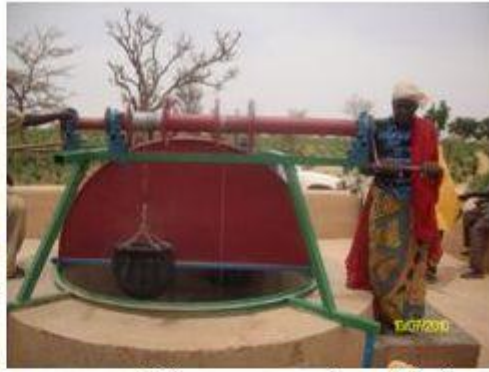
Puisage au portique Akali