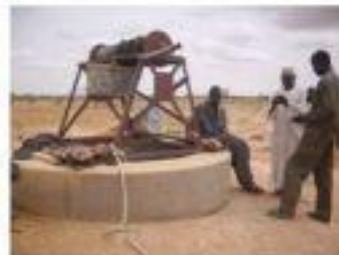
Foçage du cuvelage