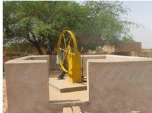
Aménagement du forage